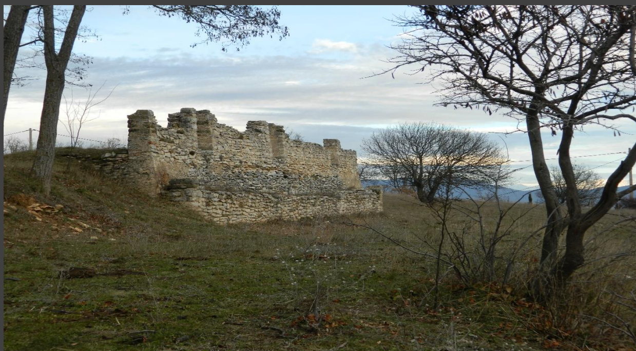
Emplacement supposé de l'ancienne église de Consonoves.

Suivant leur ordre de progression et leurs indications, la ruine de cette église se situe à Chapelet et pourrait être çà . Elle était déjà en ruine en 1721.