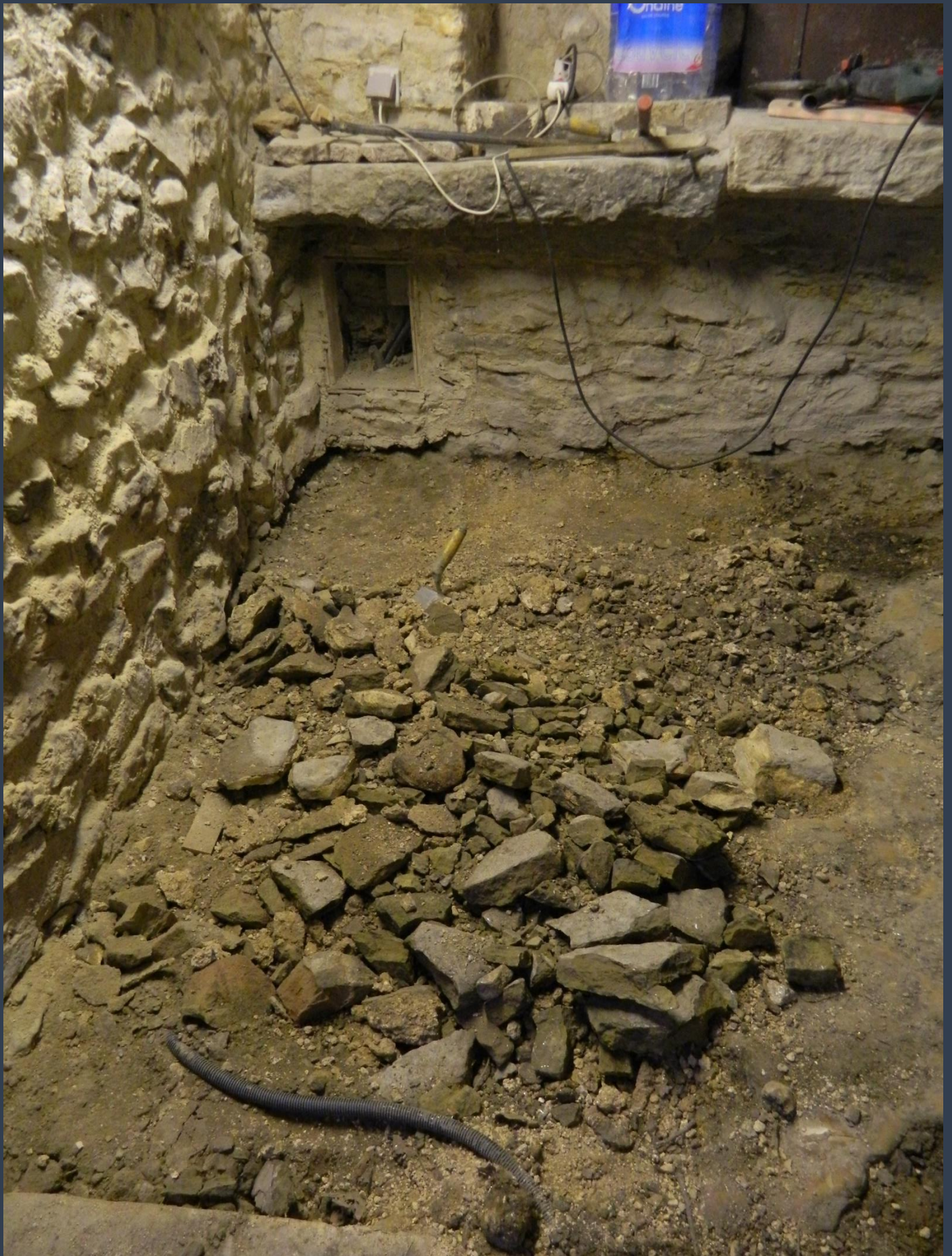
Juillet 2017 : piquage et enlèvement des vieilles pierres.