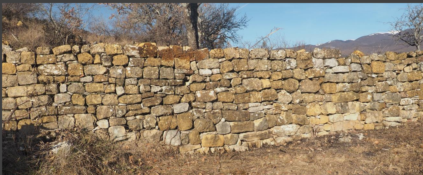
Remonté, il a fiere allure.

Durant cette période de restriction, la retranscription des anciens documents a continué. Actuellement, nous en sommes aux comptes-rendus des « conseils municipaux » des années 1744 / 1745.