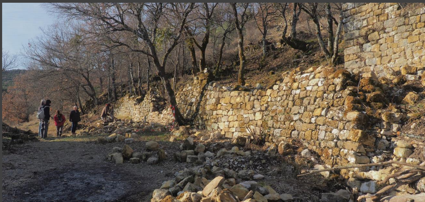
Purge des murs jusqu'à une base saine.