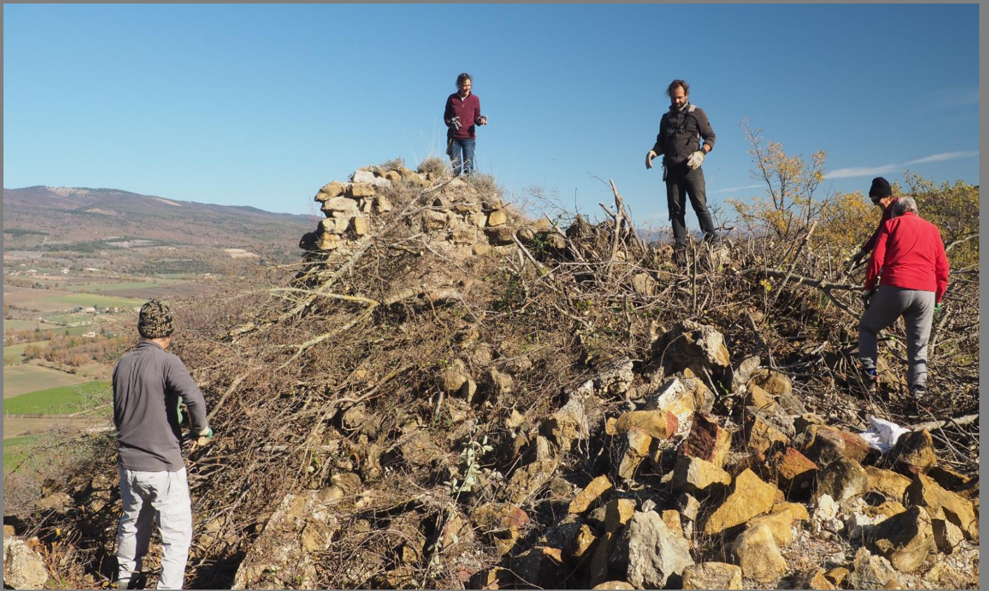
Un nettoyage va permettre aux archéologues de scanner ces vestiges.